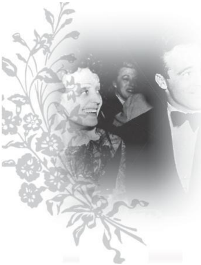
Их счастливые дни.