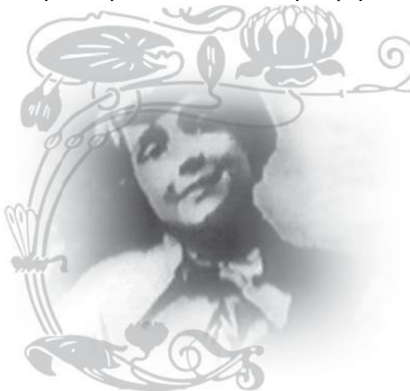
Эдит Гасьон школьница.

А хозяйка публичного дома тут же полезла в тайный шкафчик за деньгами. Она могла обмануть, кого угодно. Но только не Святую Терезу.