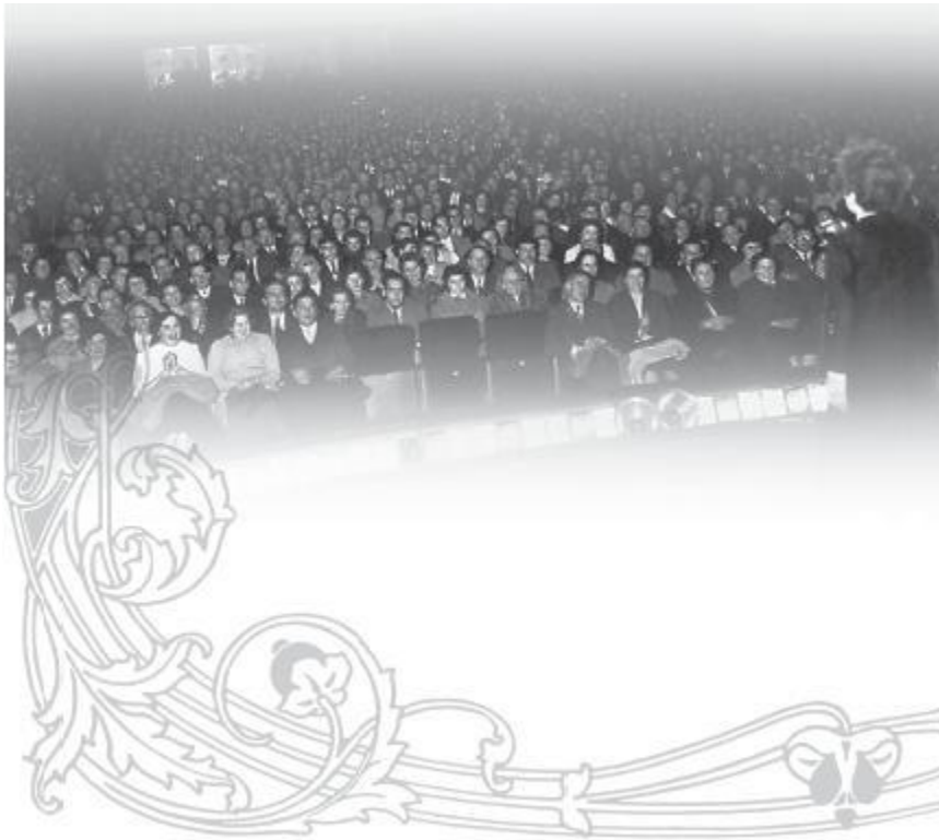
На сцене Эдит Пиаф.