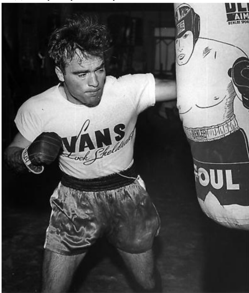
Марсель на тренировке. 1948

– Да? Я чувствую себя музейным экспонатом, – засмеялась Пиаф.