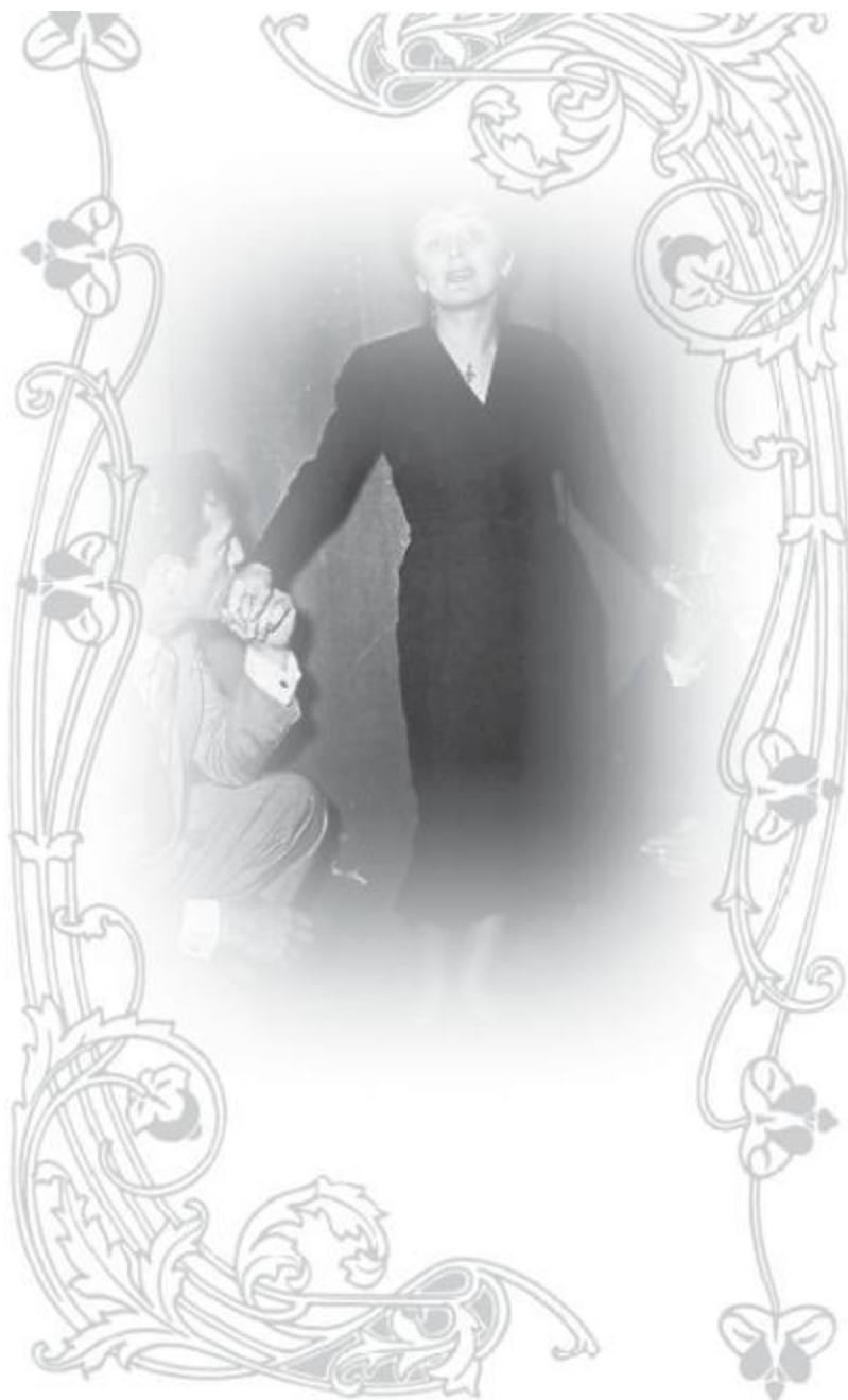
С Монтаном (слева) и