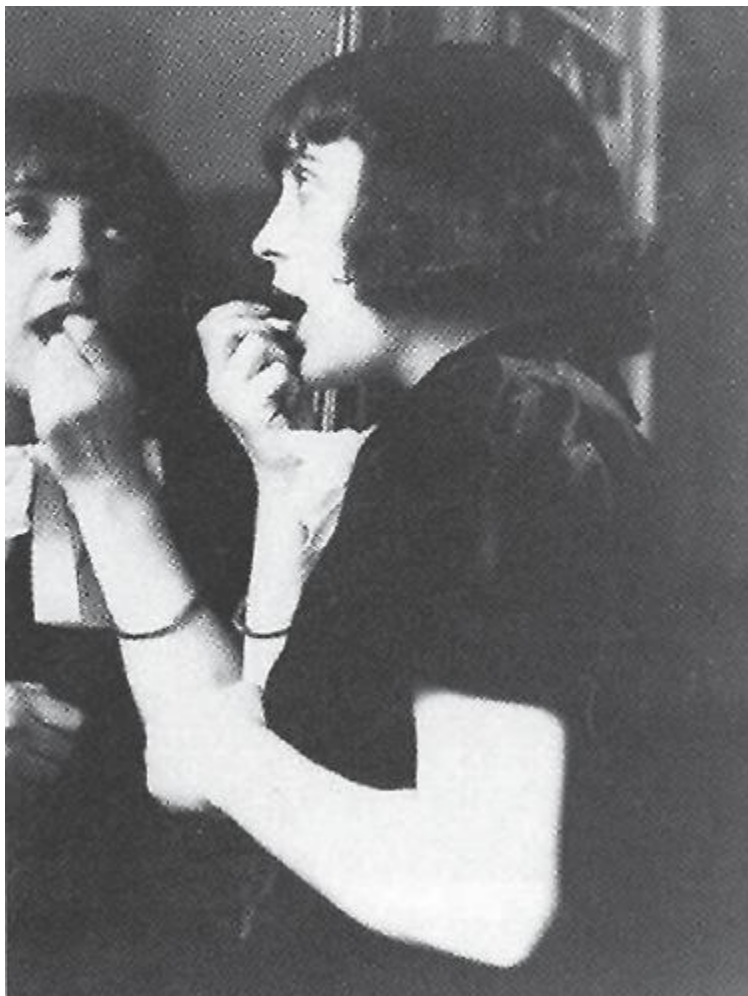
Перед выходом на сцену.

Возразить на это было нечего. И приятель Пиаф пристыженно замолчал.