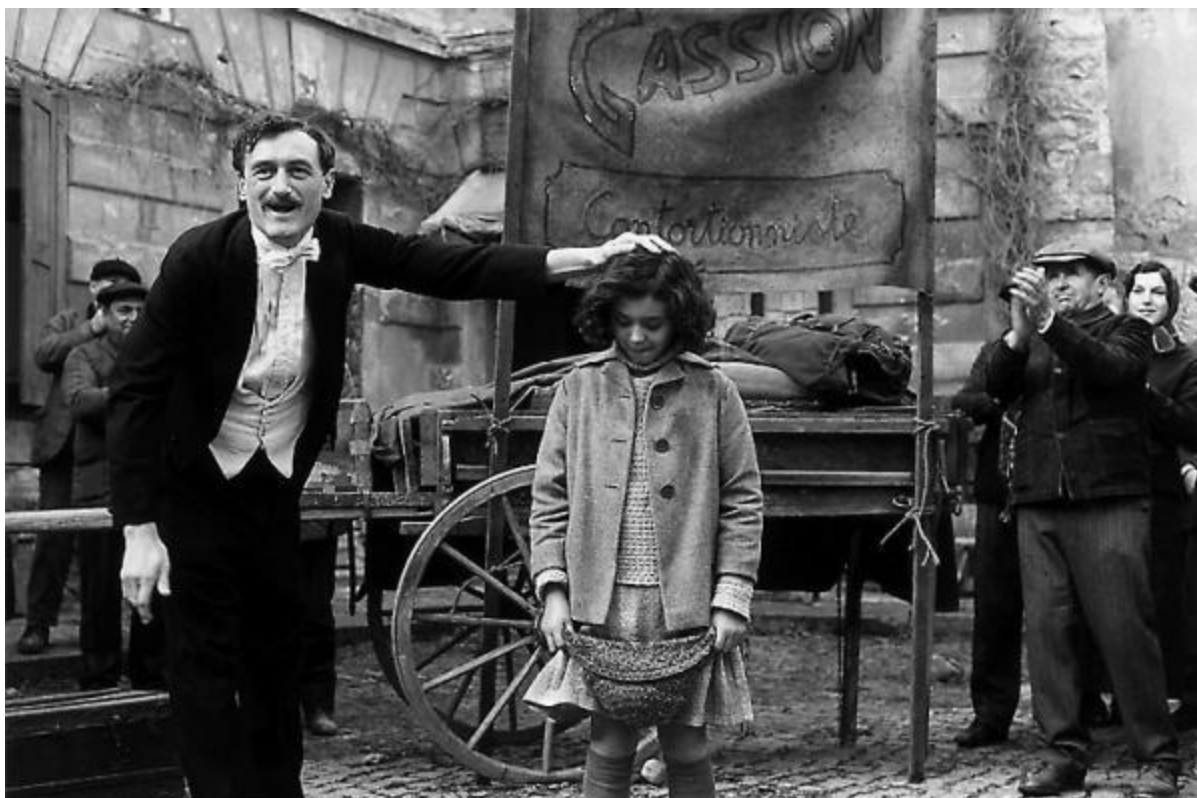
Кадр из фильма «Жизнь в розовом цвете» об Эдит Пиаф. 2007 год.

В эти годы, а это длилось около пяти лет, у Эдит были замечательные игрушки. И она всегда ела досыта.