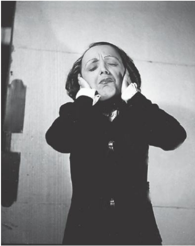
Эдит Пиаф на записи песни.