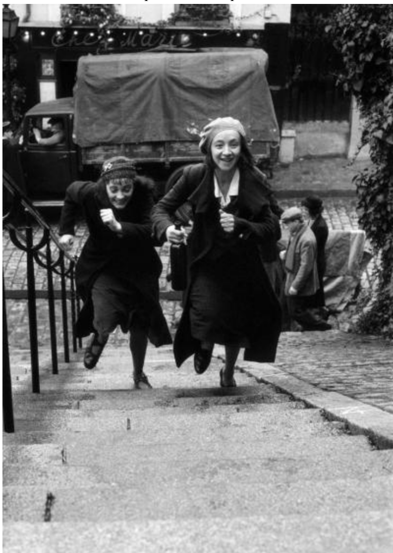
Кадр из фильма «Жизнь в розовом цвете» об Эдит Пиаф. 2007 год.