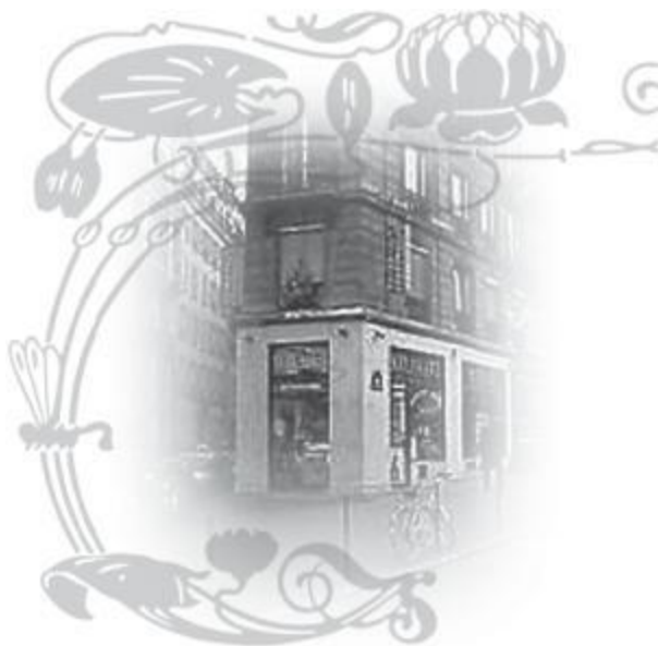
Дом, где прошло детство Пиаф.