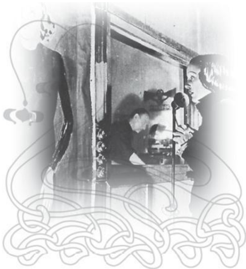
В студии звукозаписи.

Главной переменной стал новый образ. На сцену «АВС» вышла не малышка Пиаф, а Эдит Пиаф. Взрослая женщина, выдающаяся певица, а вовсе не бывшая уличная девчонка. Малышка исчезла, но... остался воробышек.