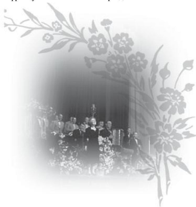
Один из концертов Пиаф.

Она и французская песня были неразделимы.