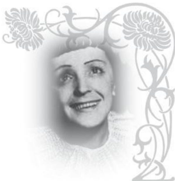
Эдит Гасьон в молодости. 1937 год.