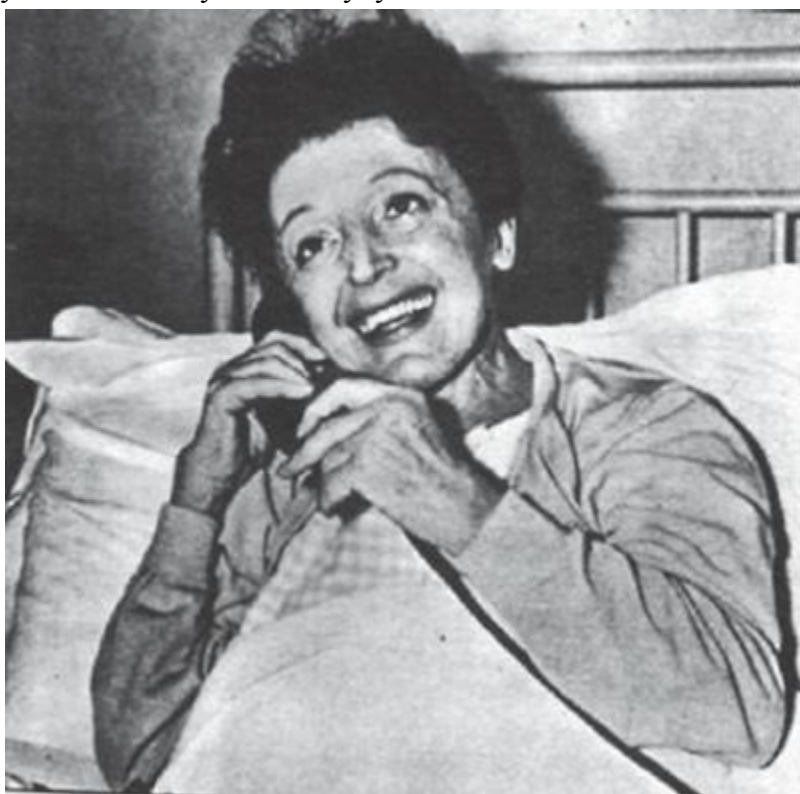
Эдит в больнице. 1969 год.

Это был один из самых тяжелых периодов жизни великой певицы. Она еще не знала, что уготовано ей судьбой в будущем... А если бы знала – поберегла бы себя? Нет, вряд ли.