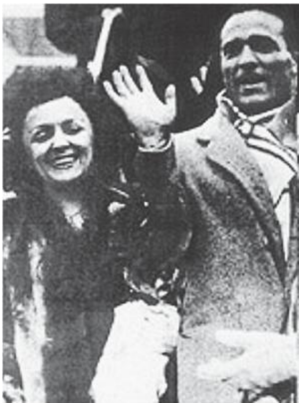
Пиаф и Сердан. 1948 год.