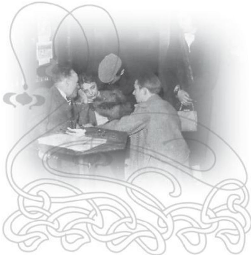
Сценка в кафе.