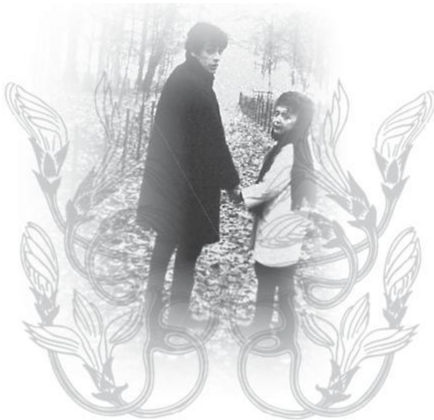
Прогулка с любимым.