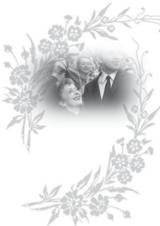
Пиаф и Тео. 1960-е годы.

– Я пока не тороплюсь, – с грустной усмешкой ответила Пиаф.