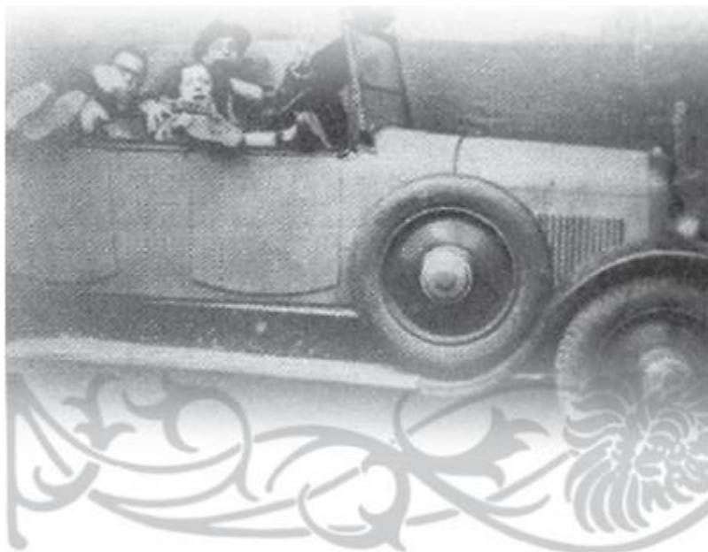
С Луи Лепле. 1930-е годы.