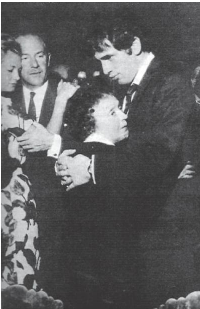
Их трогательный танец.