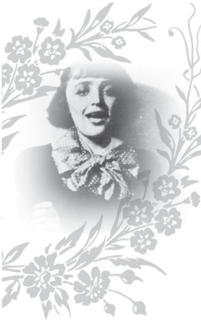
Эдит Пиаф. 1936 год.