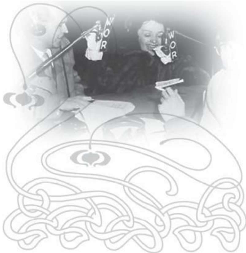
Эдит Пиаф на радио.

Ее удивительный голос возносился под самые своды – «падам, падам, падам»... Зал рыдал от восторга!