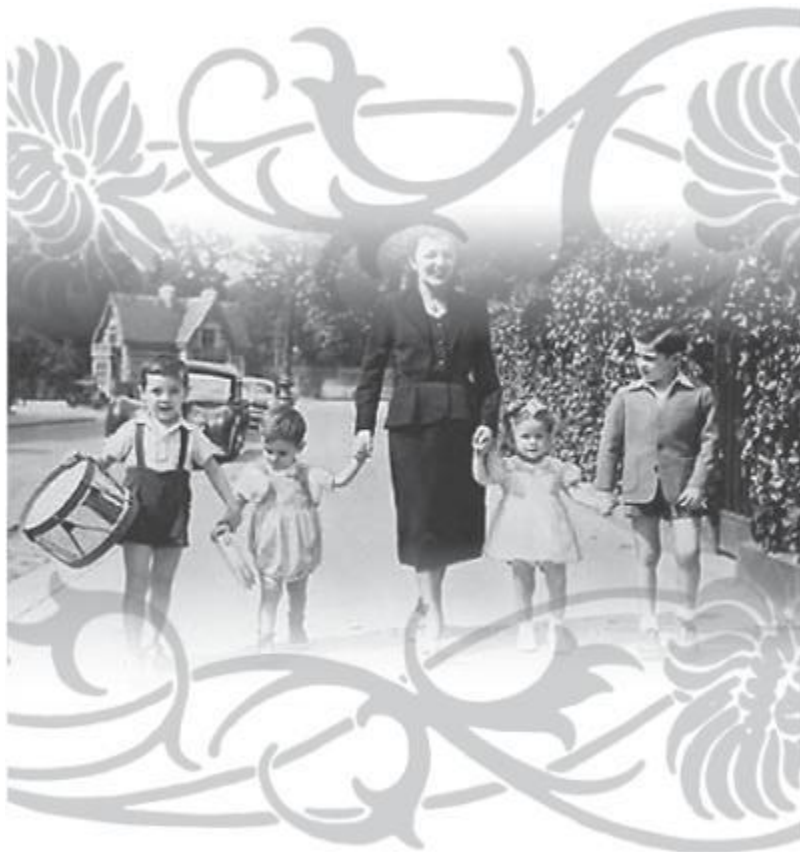
«Тетья Зизи» и дети Сердана (в кадре три мальчика Сердана и соседская девочка).

А рядом крутились трое пареньков-подростков – все, что оставил после себя Марсель Сердан.