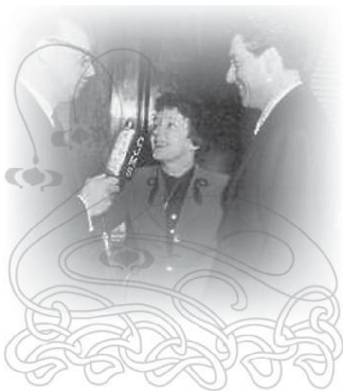
С Жаком Пилсом (справа).