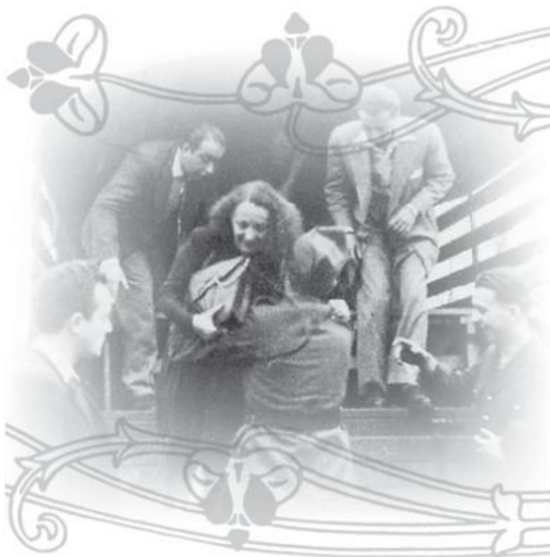
Эдит Пиаф в годы войны.

Большой киноактрисой она так и не стала. Но свой след в искусстве, безусловно, оставила.