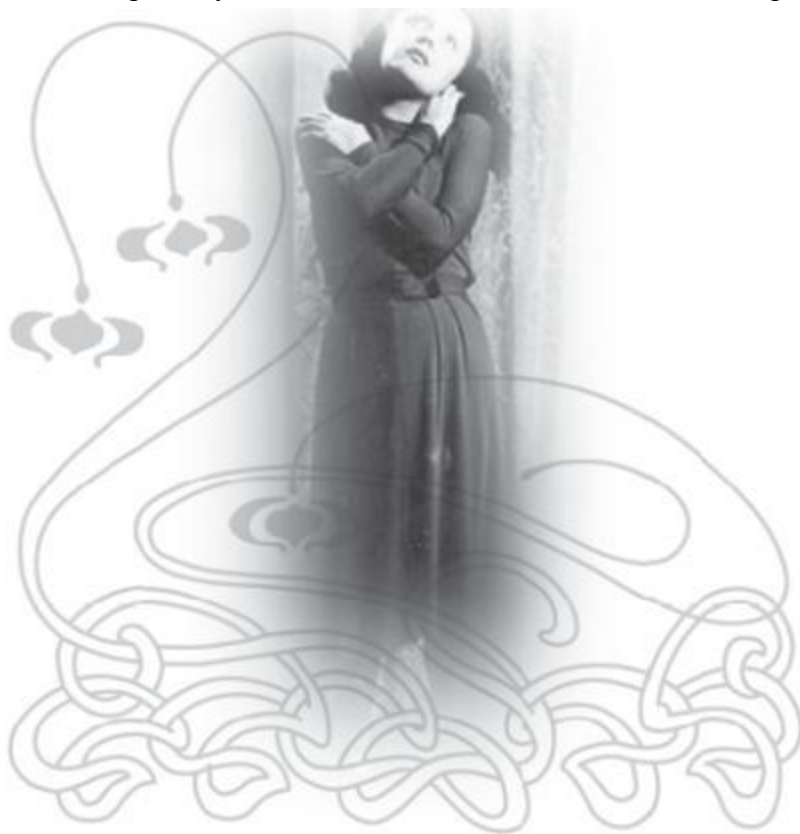
Эдит Пиаф в кабаре

– Постарайся успеть хотя бы до шести. Иначе мы потеряем пианистку.