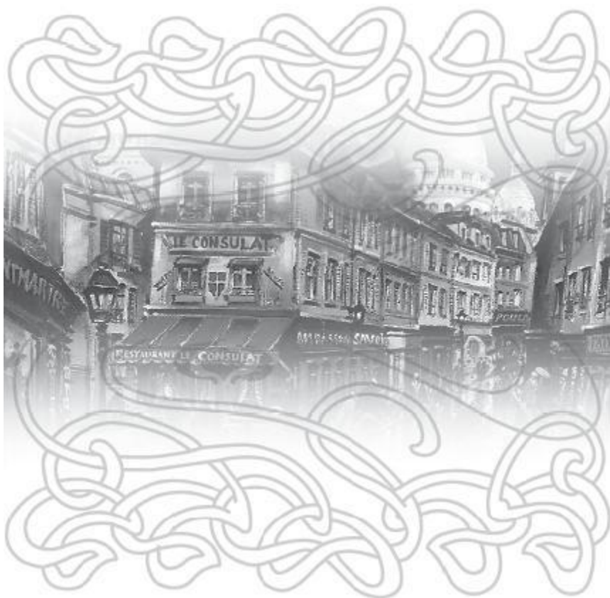
Так выглядел родной дом

Удивительно ли, что первый мужчина в жизни Эдит появился, когда ей было всего четырнадцать? Впрочем, имени его она не запомнила.