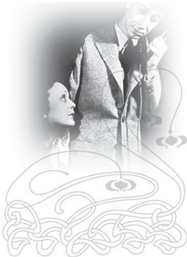
С Ивом Монтаном.