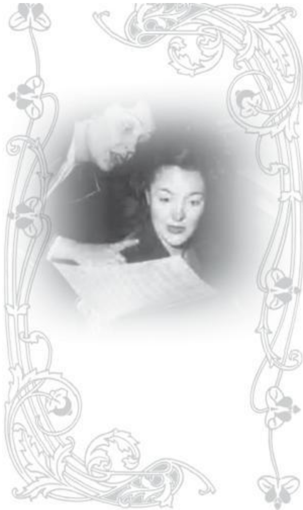
Рождение новой песни Эдит.

– О, Марсель! – разобрала, наконец, Моно. – Это ты, любимый. Я знаю, это ты... Почему ты сердишься? Не сердись. Я немного пьяна, но не настолько, чтобы ты разлюбил меня. Ведь ты же меня не разлюбил? – И Эдит снова расхохоталась.