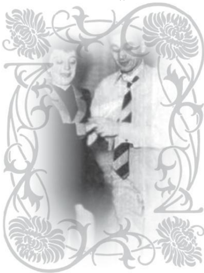
С Шарлем Азнавуром.