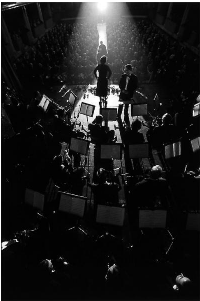
Кадр из фильма «Жизнь в розовом цвете». 2007 год.