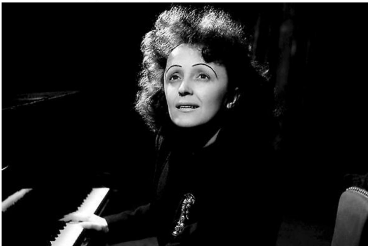
Эдит Пиаф. 1945 год.