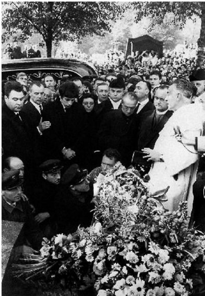
Прощание с Пиаф на