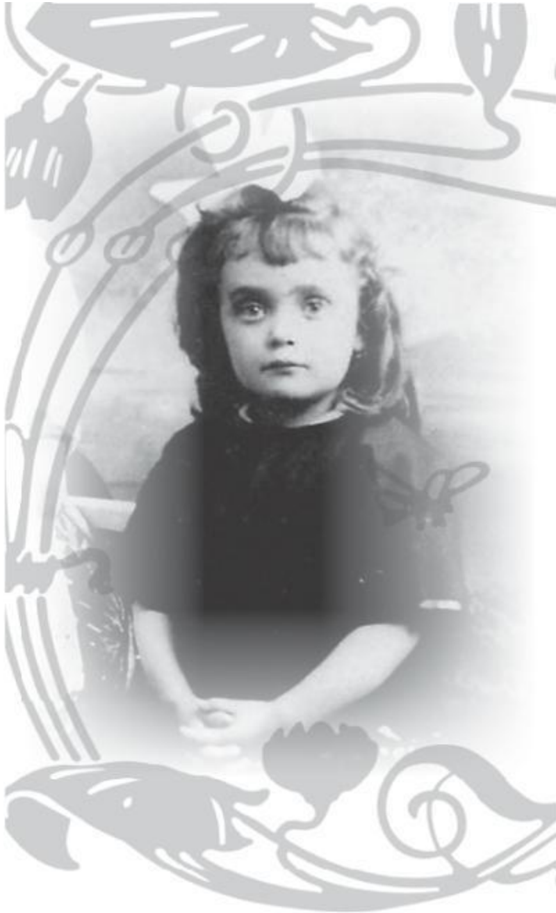
Одна из первых фотографий