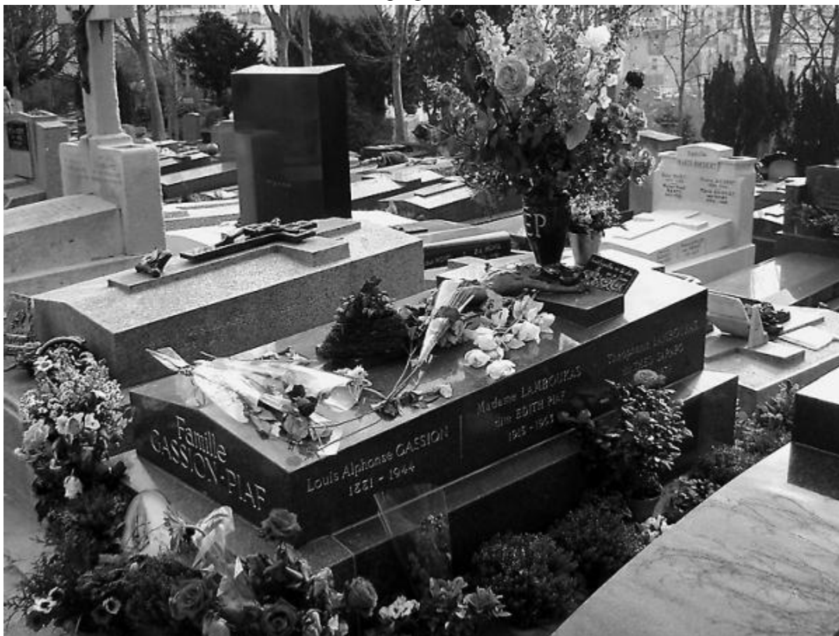
Могила Эдит Пиаф на кладбище Пер-Лашез. Париж.

только он. Следы давнишней авткатастрофы.