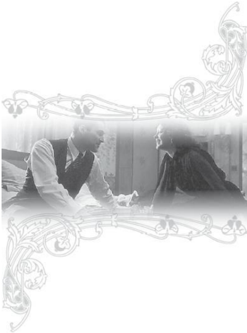
Кадр из фильма «Жизнь в розовом цвете» о жизни Эдит Пиаф. 2007 год.

Сердан спулся с галерки и машинально взглянул в ложу. Там стояли двое. Бледный как полотно Морис Шевалье и плачущая Полетт Годдар. Шевалье – великий французский певец, друг Пиаф. Годдар – замечательная актриса, сыгравшая в фильмах «Огни большого города» и «Диктатор» главные роли, бывшая супруга Чаплина и будущая – немецкого писателя Эриха Марии Ремарка.