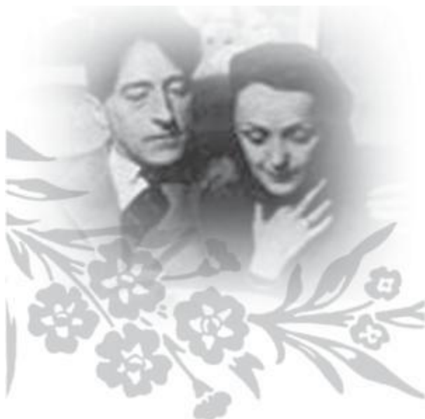
С Жаном Кокто.