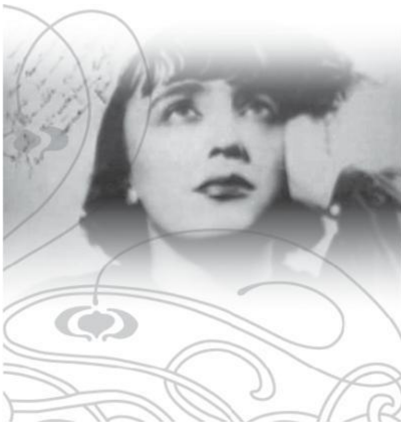
Эдит Пиаф в молодости.